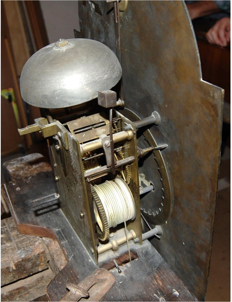
Urværket. Her ses bl.a. den ene af snorene som lodderne hænger i.